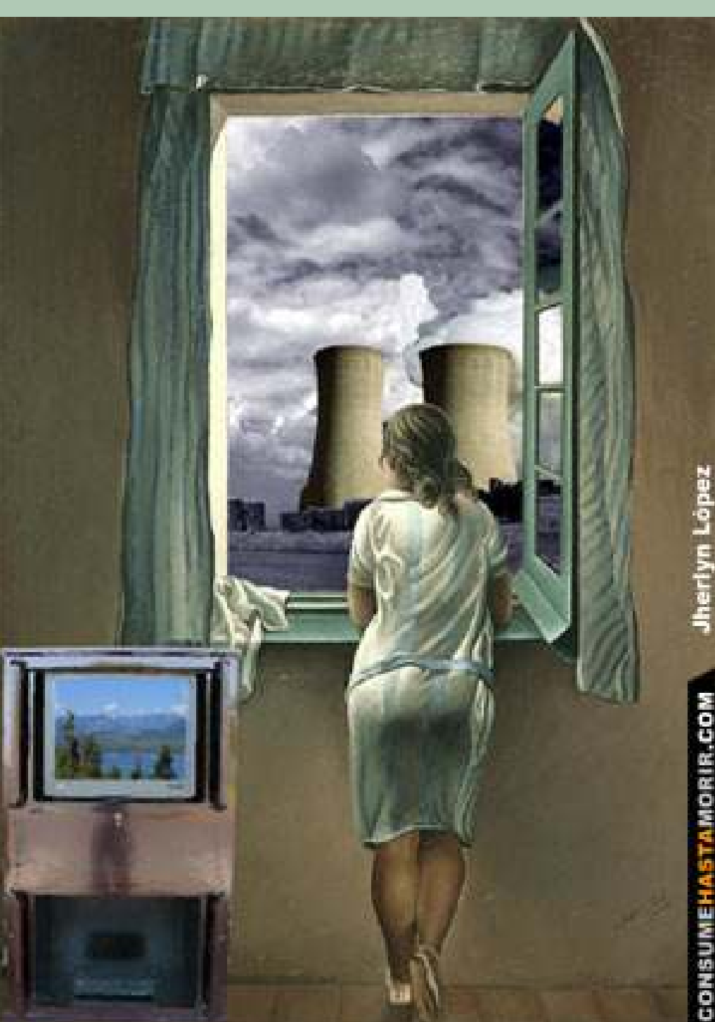
Jherlyn Lopez CONSUME HASTA MORIR.COM

BASURA NUCLEAR Es mortalmente radiactiva, permanece así cientos de miles de años y son fuente de contaminación de suelos, aire y agua.